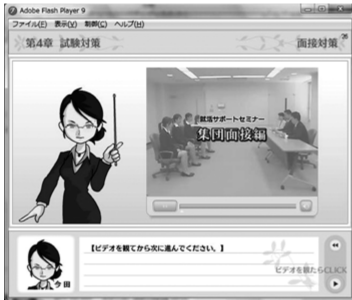
図6：Flashアニメーション作成例

さらに、各章に章末問題を作成し、インターネットナビウエアの機能により、簡単な確認問題各2問程度を作成した。また、この教材の終了時には、履歴書と自分史を作成する