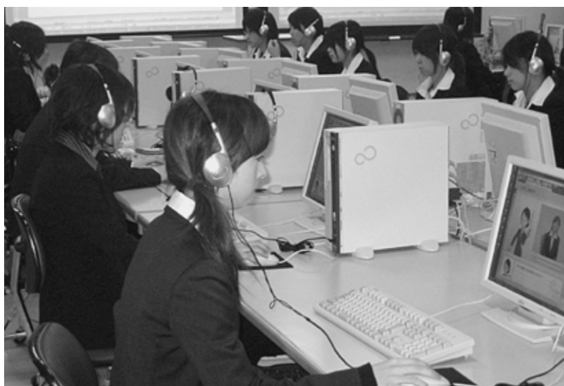
図7：春期セミナーでの就職対策eラーニング教材使用風景

なお、このeラーニング教材を就職活動中の学生指導にどのように活用すればよいのかについての分析は、今後の検討事項として次回の紀要に発表することにしたいと考えている。