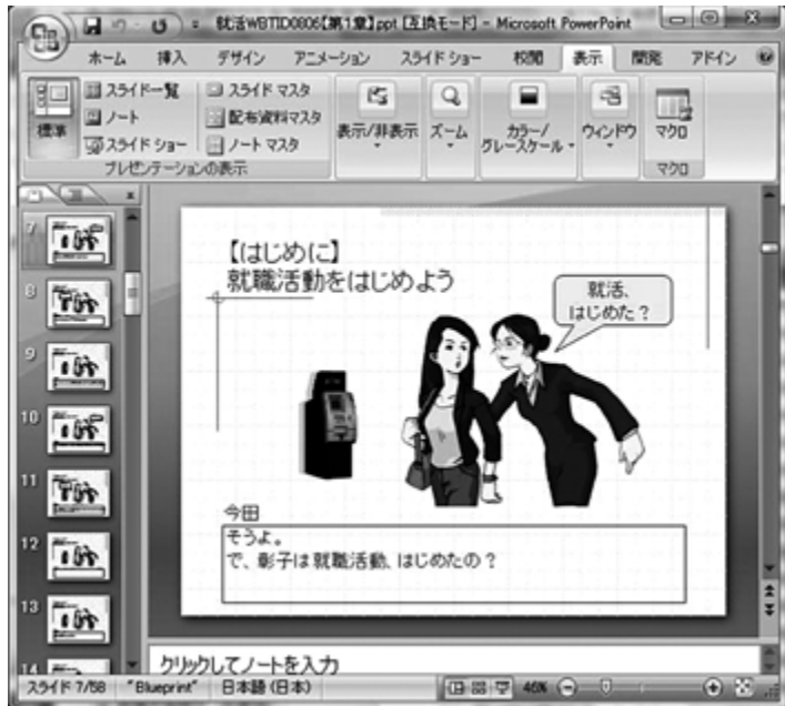
図5：ストーリーをスライド化した例