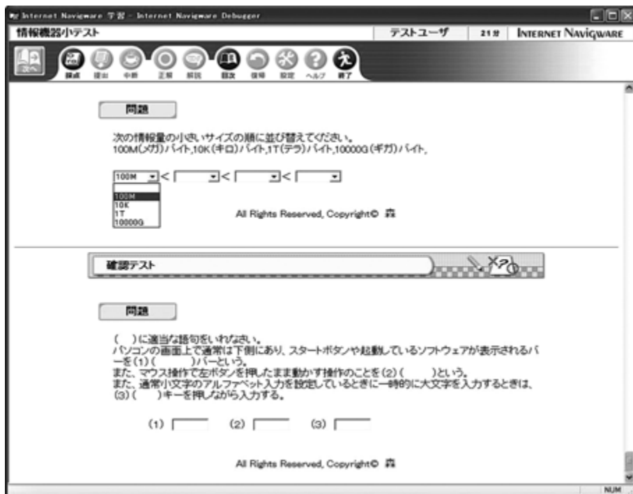
図2：小テストのプルダウン式選択問題・記述式問題例

この小テストのeラーニング教材により、厳正な試験実施、採点結果の正確性、結果・統計処理までの時間短縮、問題更新の容易性などの利点を有している。また、この試験についてのアンケートを実施したところ、ほぼ100%の学生がペーパーテストよりeラーニング教材の試験のほうがよいという結果が得られた。さまざまな検定試験が、紙のものからコンピュータ上に移行しているのも現実である中、学内の試験もeラーニング化できるものに関しては、すべきであると考えている。この教材をきっかけにeラーニング教材で試験を作成する教員が増加することを願っている。特に、映像、音などメディアを共存させて問題を作成できることは、大きな利点である。