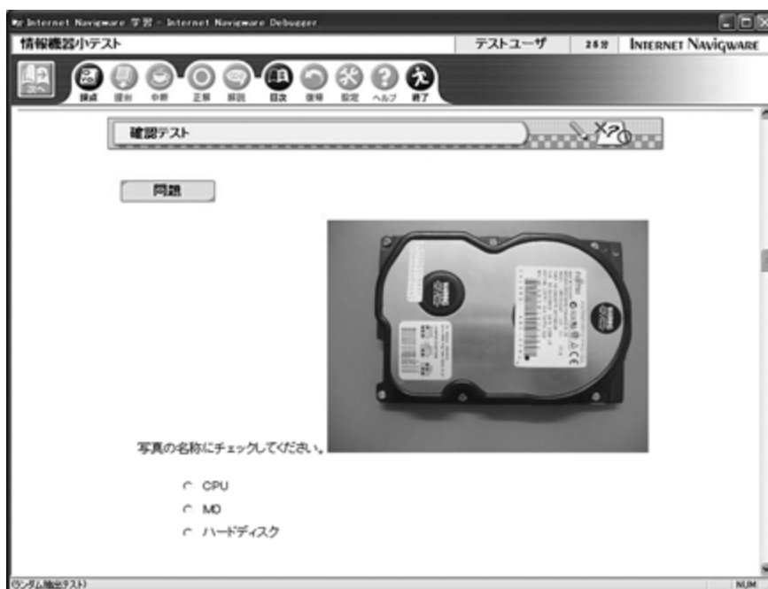
図1：小テスト選択式問題例

そこで、双方にメリットがあるテスト教材を開発することにより、利用頻度を向上させることができないかということもあり、このeラーニングシステムの教材作成のためのサービスを利用して、テスト教材を開発することにした。作成したテスト教材は、情報機器演習Ⅰ（教養科目）で使用する。特徴として、選択式（プルダウンメニュー、ラジオボタン）、記述式（完全一致）等の問題は、採点をする時に有効的である。しかし、完全一致でない論述式の問題は、コンピュータ採点が不可能なため出題方法を考えなくてはいけない。また、終了すると同時に、採点がされ、点数の表示非表示、採点答案の表示非表示を選択できる。今回作成した小テストでは、日商 PC 検定の知識科目と同様に、点数のみ表示させている。（2008年度からは点数を非表示）さらに、出題をカテゴリごとに分類することができ、その中からランダムに何問中何問出題させることが可能である。そのため、ランダムに選択して出題されるため、受験する全員が異なるテスト問題を解答することになる。しかし、あるカテゴリを2問中2問出題するとしておくと必ず全員に出題される問題も作成することが可能である。このことは、カンニング防止に役立っている。また、不正防止のためテスト開始時間の指定や1回しかテストを実施できないようにするオプション機能も用意されている。