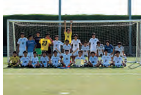
準優勝・サッカー

高松大学・高松短期大学 公式Facebookページをチェック！ 大学のトピックスやオープンキャンパスなど、キャンパス情報を紹介しています。