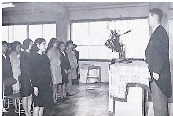
第1回入学式(昭和44年)

この五十周年を機に、これまで培った伝統を踏まえ、次世代に向けた特色のある教育・研究を押し進め、社