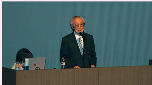
速水高松大学客員教授の講演