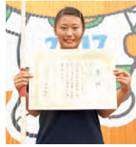
第3位・陸上 (女子やり投げ)