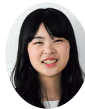
大学祭実行委員長 大学 経営学部経営学科二年