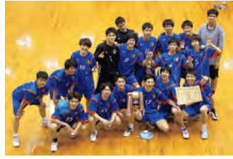
優勝・ハンドボール