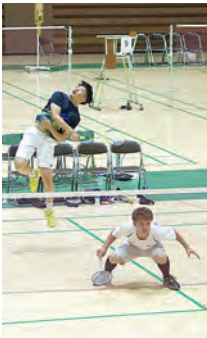
第4位・バドミントン (男子団体)