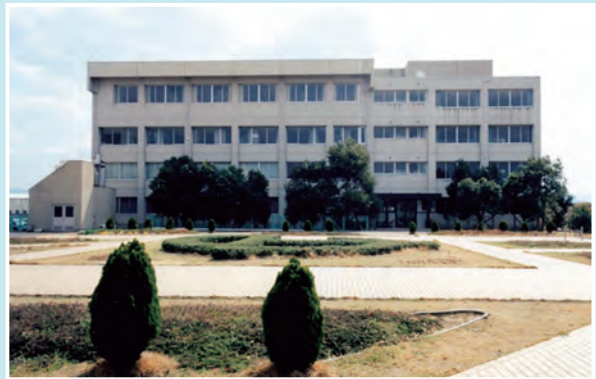
平成元年 秘書科の学び舎(1号館)