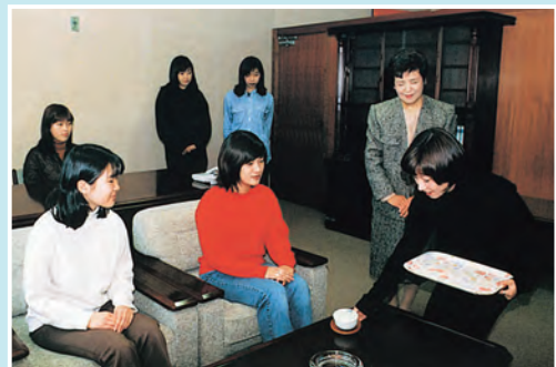
平成9年 授業(秘書実務演習)