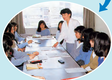
平成2年 少人数制の研究室活動