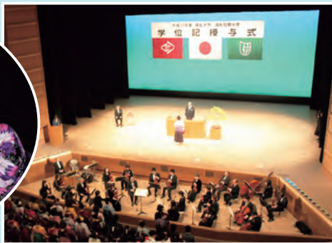
平成23年度 学位記授与式