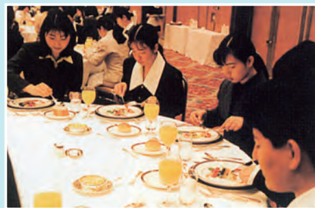
平成11年 新入生歓迎セミナー