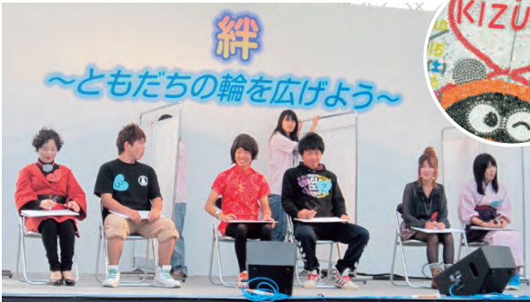
昨年の大学祭の様子

今年の大学祭のテーマは、「PUZZLE ～十人十色～」です。パズルのピースの形が一つ一つ違うように人の個性も様々です。形の違うピースは一つ一つが繋がることで一つの絵を作り出すことが出来ます。一人一人の個性と繋がりを大事にしたいという意味が込められています。昨年引き続き、東日本復興支援やエコ活動、スポーツフェスを企画しています。 また、メインステージでは、恒例のミスコン、よさこい、マネキン5やジャズ研究会によるライブなども予定しています。 毎年好評をいただいている大学発達科学部の「げんき村5丁目わんぱく通り」や短大保育学科の「ほいくのくに」などの子ども向けイベントも開催します。お子様連れで、是非ご来場ください。