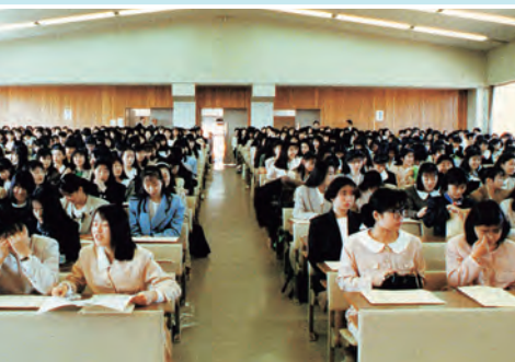
平成4年 入学式オリエンテーション