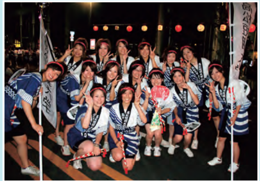
平成19年 さぬき高松まつり「秘書科連」