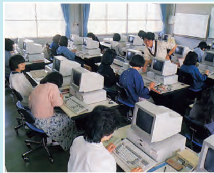
昭和62年 授業(情報処理)