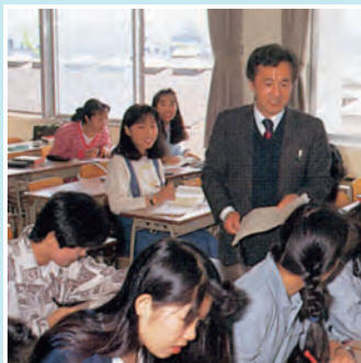
平成3年 授業(実用英語Ⅰ)